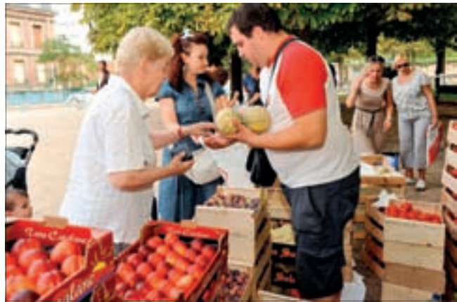
FRUITS ET LÉGUMES AU "JUSTE PRIX".

Des producteurs de fruits et légumes ont pris d'assaut la Bastille à Paris et la place de la Libération à