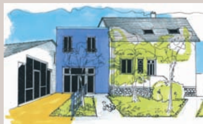
RÉOUVERTURE DES PORTES À LA MI-OCTOBRE.

Après d'importants travaux de remise aux normes et d'agrandissement, le centre d'accueil Solidarité enfants Sida (Sol en Si) de Bobigny ouvrira à nouveau ses portes mi-octobre. La crèche qui accueille des bambins de 6 mois à 3 ans dont les parents sont atteints du VIH et d'autres non passe de vingt à vingt-quatre places. "Nous avons déjà 32 pré-inscriptions