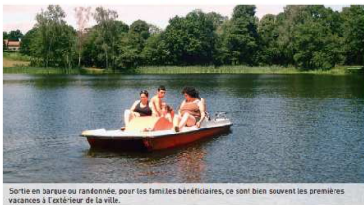
Sortie en barque ou randonnée, pour les familles bénéficiaires, ce sont bien souvent les premières vacances à l'extérieur de la ville.